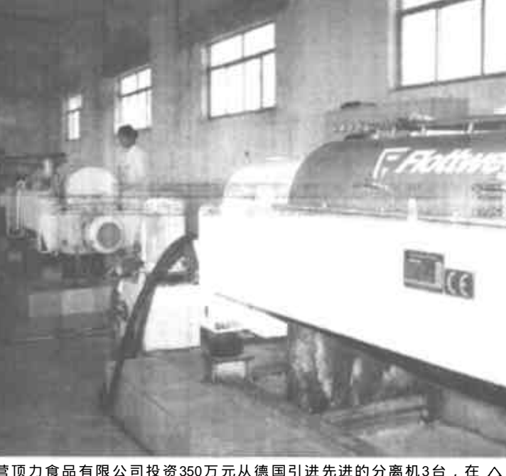
東營頂力食品有限公司投資350萬元從德國引進先進的分離機3台，在△油地雙方共同扶持下，公司生產銷售呈現良好發展態勢，生產的4種大豆蛋白供不應求。今年1—10月份，生產大豆分離蛋白600噸，創產值660萬元。（劉克亮 攝）

據四礦的工作人員回憶分析，破壞地衡的△油地雙方共同扶持下，公司生產銷售呈現良好發展態勢，生產的4種大豆蛋白供不應求。今年1—10月份，生產大豆分離蛋白600噸，創產值660萬元。（劉克亮 攝）